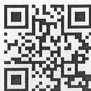
題庫 QR CODE