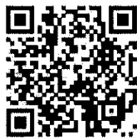
勞工局 活動線上報名 *新課程約於每 季初上線

介紹工資工時之一般性規範之重點，並與部分工時、試用期及專科以上學校兼任助理等類型勞工常適用之工資工時及勞動契約相關規定加以比較說明。