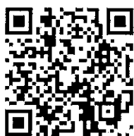
勞工局 活動線上報名 *新課程約於每 季初上線

藉由實務案例及常見之勞資爭議, 說明勞動基準法之新修適用範圍、勞動契約之特徵(包含與委任、承攬之區分)、勞雇雙方之權利義務、契約之內容、變更及終止(包含定期契約、勞動條件之變更、調職、解僱、離職)、離職時常見之勞資爭議問題、勞動派遣之新修正規定及修法動態、以及最低服務年限、競業禁止等相關規範加以說明, 並說明如何藉工作規則建立勞動制度。