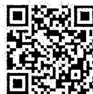
勞工局 勞動權益通 App